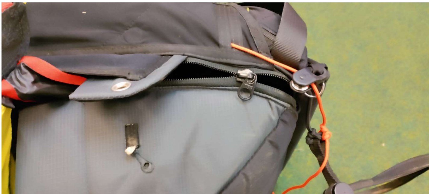
Abbildungen: Erschwerte oder blockierte Auslösung des Retters durch den teilweise geöffneten Zip