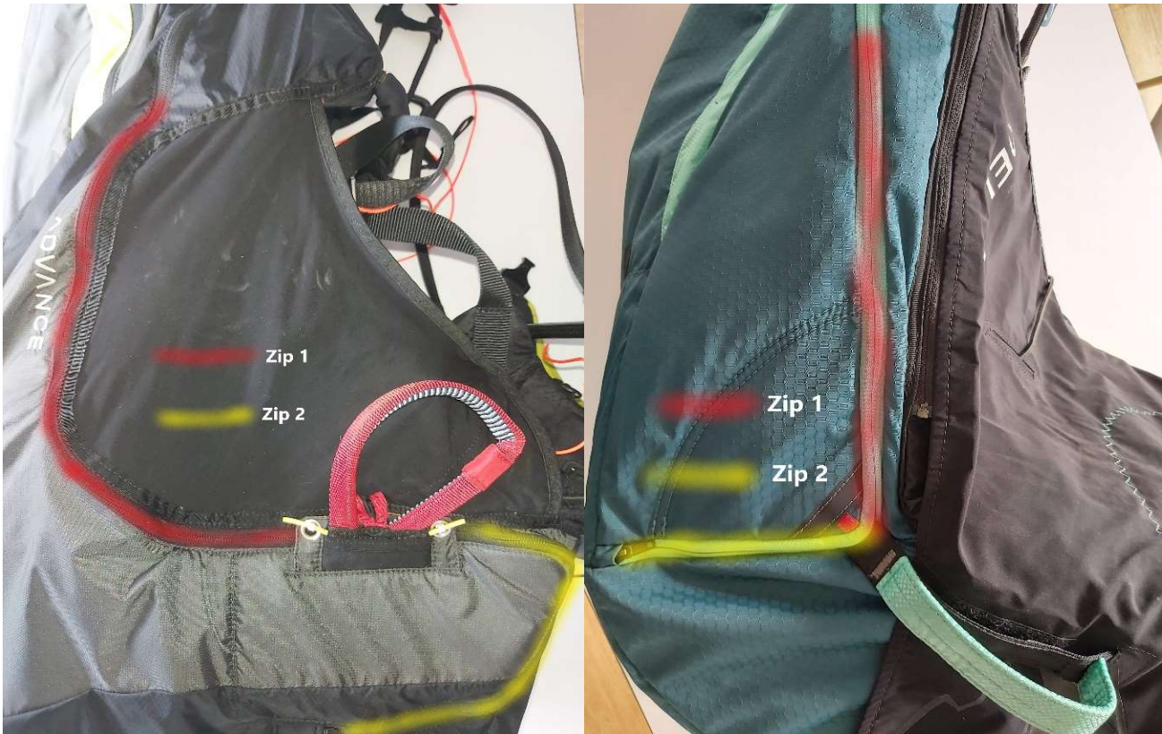
Abbildungen, Beispiele: (hauptsächlich) Zip 2 verschließt den Rettungsgeräte-Container

Potenziell betroffen sind Gurtzeuge mit 2 Reißverschlüssen, bei welchen ein separater Zip den Rettungsgerätecontainer verschließt.